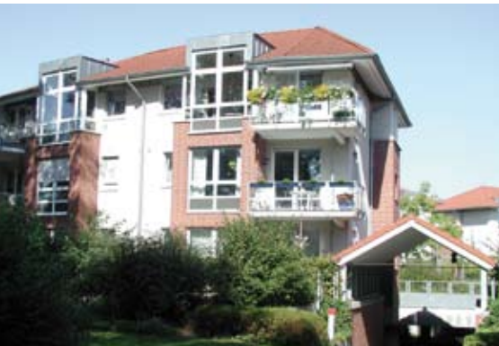
Leverkusen-Schlebusch: Realisierung eines Mehrfamilienhausgebietes auf ehemals industriell genutzter Fläche

Das Handlungsprogramm ‚Zukunft Wohnen‘ wurde grundsätzlich und erstmalig im Jahr 2000 erstellt und durch den Rat beschlossen. Damit wurde eine wichtige Grundlage für die Wohnungs- und Stadtentwicklungspolitik geschaffen, die konkrete Ziele und Strategien in Form von Handlungsfeldern benennt, z. B.: