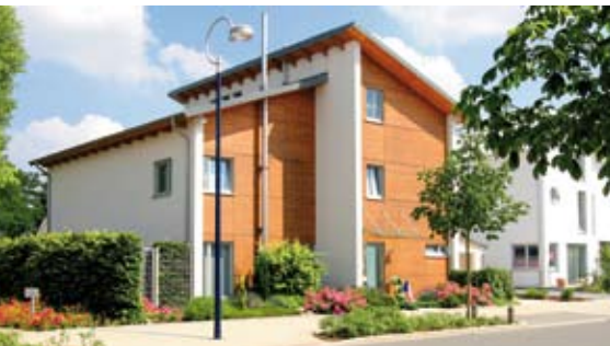
Stärkung der Attraktivität als Wohnstandort

Der Masterplan Wohnen ist auf Basis der kommunalen Wohnungsmarktbeobachtung gemeinsam von verschiedenen Akteuren aus Politik, Verwaltung und Wohnungswirtschaft entwickelt und erarbeitet worden. Dieser bildet den Rahmen für die kommunale Wohnungspolitik, in dem drei übergeordnete Ziele für die künftige Wohnungspolitik formuliert werden: