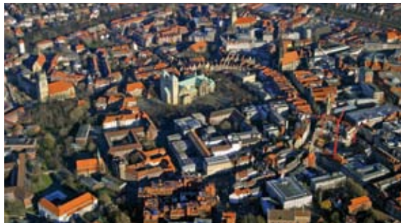
Wohnstandort Münster: Wohnungsmarkt als Anreiz zur Wohnortwahl

Das Handlungsprogramm Wohnen ist das Rahmenkonzept der Stadt Münster zur Wohnungs- und Baulandpolitik. Darin werden die Ziele und Positionen der Stadt in der Bauland- und Wohnungspolitik festgelegt. Das Handlungsprogramm Wohnen wurde 1993 erstmalig beschlossen und 2005 zum dritten Mal fortgeschrieben. Es besteht aus mehreren Handlungsfeldern, die im Rahmen der Fortschreibungen ergänzt werden. Zu den Handlungsfeldern zählen u. a.: