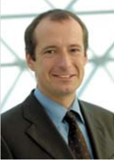
Oliver Wittke Minister für Bauen und Verkehr des Landes Nordrhein-Westfalen

Wohnungspolitik braucht die Experten vor Ort. Kommune und wohnungswirtschaftliche Akteure müssen sich über die Entwicklungsvoraussetzungen und Gestaltungsmöglichkeiten verständigen, um die örtliche Wohnungsmarktsituation erfolgreich weiter zu entwickeln. Wohnraumförderung muss marktgerechte Maßnahmen initiieren und unterstützen, denn die gravierenden demografischen und sozialen Veränderungsprozesse beeinflussen die örtlichen Wohnungsmärkte in sehr unterschiedlicher Ausprägung. Deshalb sind eine ortsspezifische Wohnungsmarktanalyse und -prognose für passgenaue Handlungsstrategien unerlässlich.